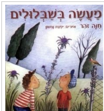
כריכת הספר בהוצאת כתר