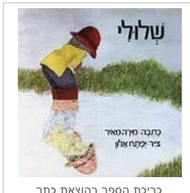
כריכת הספר בהוצאת כתר