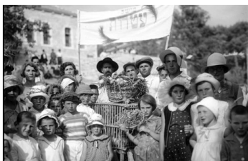
ירושלים, הבאת ביכורים 1931

תכלו לאמץ את הלך הרוח של הקיבוצים, ולחשוב יחד: האם יש משהו חדש שאני מצליח/ה לעשות פעם ראשונה בזמן האחרון? על מה התאמצתי במיוחד לאחרונה- ואני מרגישה/ש אכן- יש לי הצלחה מיוחדת?