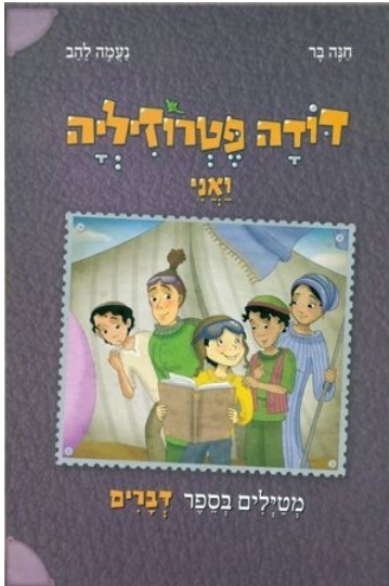
כריכות ספרים מתוך הסדרה, בהוצאת דני ספרים