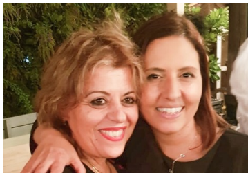
ח"כ גילה גמליאל ומורתה- גילה