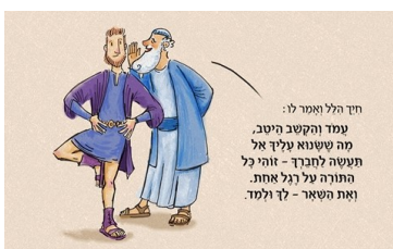
מתוך אתר אגדה לילדים