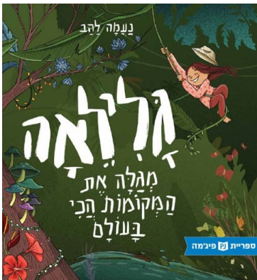
כריכת הספר בהוצאת עם עובד