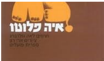
כריכת הספר בהוצאת ספריית הפועלים