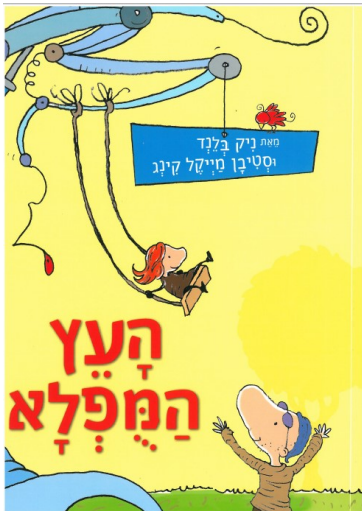
כריכת הספר בהוצאת מזרחי מדיה