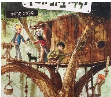
כריכת הספר בהוצאת כנרת זמורה דביר

ילדי בית העץ זהו מיזם אמנותי רב גוני, המורכב מסדרת ספרים, מוזיקה, סדרת טלוויזיה, ואפילו הצגה. הספר הראשון בסדרה נקרא: מבצע חורשה.