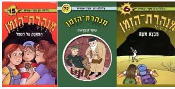
כריכות ספרים מתוך הסדרה, בהוצאת מודן